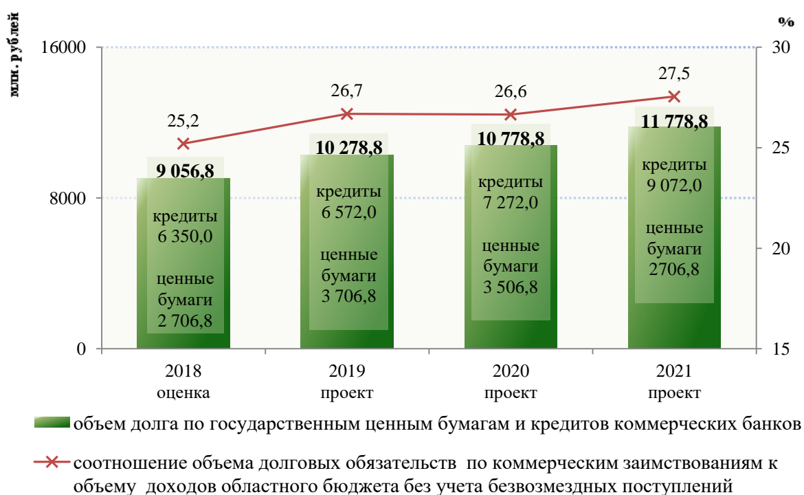
Долговые обязательства по коммерческим заимствованиям 2018-2021 годов

Анализ приведенных данных показывает, что в период с 2018 по 2021 годы увеличение долга по кредитам от кредитных организаций составит 2 707,0 млн. рублей (с 6 350,0 млн. рублей до 9 072,0 млн. рублей); по ценным бумагам с 2018 по 2019 год увеличение составит 1 000,0 млн. рублей, в период с 2020 по 2021 год предусмотрено сокращение на 1 000,0 млн. рублей, таким образом, долговые обязательства по государственным ценным бумагам Российской Федерации, номинальная стоимость которых указана в валюте Российской Федерации останутся на уровне обязательств 2017 года – 2 706,8 млн. рублей.